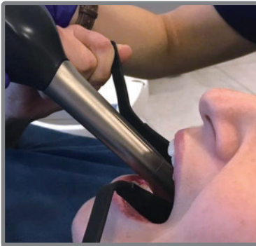
표면이 부드러워 환자의 구강내에 달아도 매우 편안하다.