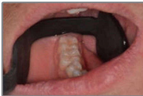
◀ 볼과 혀를 동시에 잡는 새로운 리트랙터